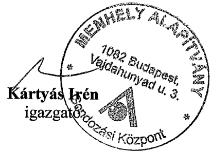
Kártyás Irén igazgató