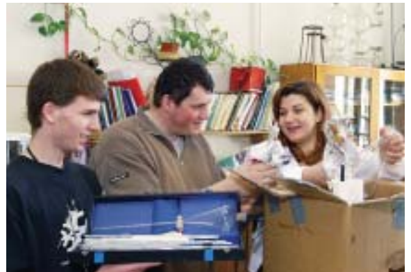
Fotónk a Kertész utcai iskolában készült, képünkön a kémiatanárnő diákok segítségével bontogatja a különféle eszközöket.

A Budapesti Műszaki és Gazdaságtudományi Egyetemen tanszékek összehívására került sor, melynek következtében feleslegessé váltak olyan kémiai laborszerek, melyek oktatási intézmények számára még felhasználhatóak. Az egyetem illetékesei a készlet megsemmisítése helyett úgy döntöttek, hogy a további felhasználás érdekében az