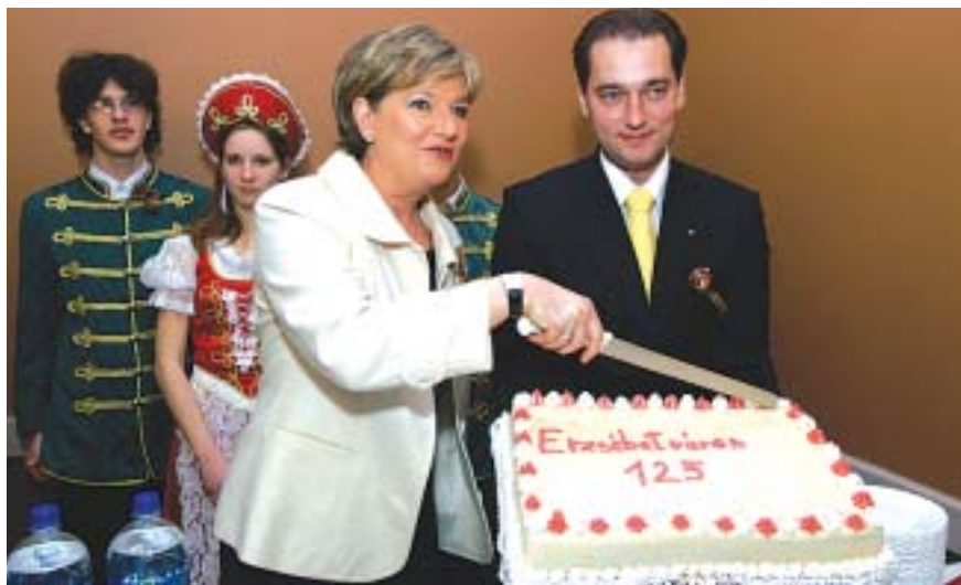
Szili Katalin az Országgyűlés elnöke és Hunvald György polgármester az ünnepségen