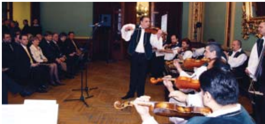
Az ünnepség résztvevői számára élvezetes percekert szerzett az Erzsébetvárosi Cigányzenekar és primása, virtuóz előadásukkal

Az ülésen Szili Katalin, az Országgyűlés elnöke Erzsébetváros fejlődését hangsúlyozta, utalva arra, hogy nemcsak múltjából kell élnie, hanem ezen a múlton gyarapodó, boldog jövőt kell teremtenie.