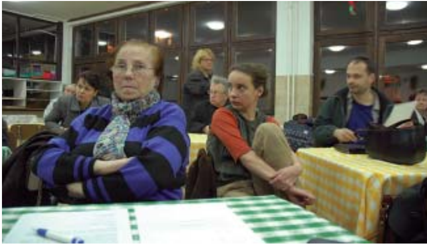
Az alakuló ülés.

2007. január 18-án megalakult a BÉKE Egyesület, amelynek - alapszabályában rögzített