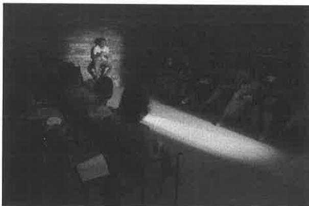
A féltestvér – ford. Patat Bence – Kerekes Márton, Ficsor Milán – Gólem Központ