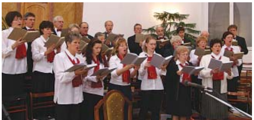
TEMPLOMI HANGVERSENY. Az Erzsébetvárosi Napok rendezvénytársaság zenei programjában is bővelkedett. November 13-án került sor a Wesselényi utcai Baptista Templom kórusának hangversenyére.

Az időjárásra a székelek hagymából jósltak. A vöröshagymából lefejtettek 12 réteget, ez az év egy-egy hónapjának felelt meg. Mindegyikbe egy kevés sót szórtak, amelyikben elolvadt, az a hónap esősnek ígérkezett, a többi száraznak.