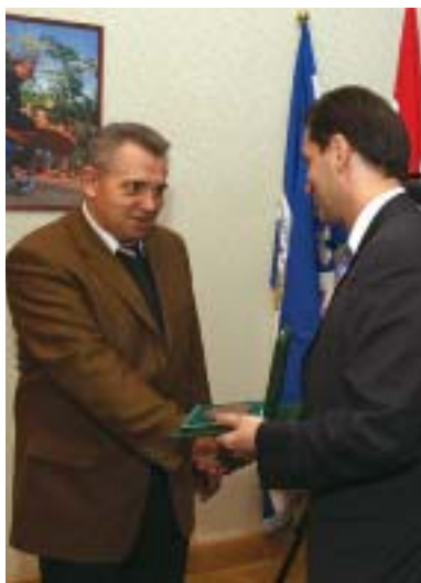
A díjakat mindhárom kitüntetettnek Hunvald György polgármester adta át

mint a versenyszakosztályokat koordinálja. Kapcsolattartóként tevékenykedik a klub, a sportigazgatási szervek valamint az önkormányzat sporttal foglalkozó szervezeti egységei között. Segítségével jutnak el a BKV Előre Sport Club sporteszköz és sportfelszerelés adományai kerületünk iskoláihoz.