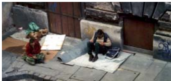
Kürt utcai csendélet... A fotót egy olvasónk küldte be a napokban

A képviselő levelet küldött az ÁNTSZ-hez és a közrendvédel-