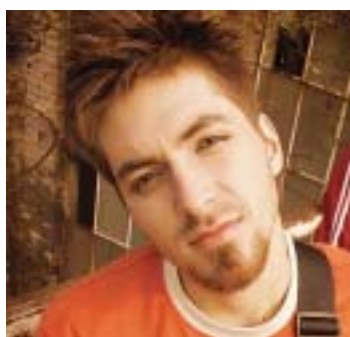
Torres Danit nagy örömmel fogadták a gyerekek

A diákoknak - a sok feladat közül - például fogalmazást kellett írniuk a jövőről, a csapat egyik tagjának a jövő divatja szerint kellett felöltöznie. Készültek barlangrajzok, és elő kellett adniuk a Fré-