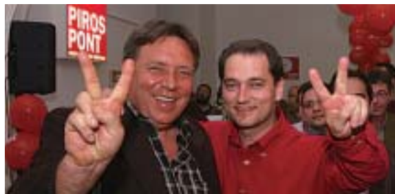
Filló Pál Erzsébetváros újra megválasztott országgyűlési képviselője, és Hunvald György polgármester, aki az MSZP budapesti listáján először került a parlamentbe

- Elsősorban a munka világával, a szociális kérdésekkel és a nyugdíjasokat érintő ügyekkel szeretnék foglalkozni. A fentiekkel kapcsolatos munkát már az előző ciklusban elkezdtem, remélem, hogy e ciklus végére újabb olyan eredményeket tudok majd felmutatni, melyeket a kerületi választók is tapasztalhatnak. Nagyon fontos, hogy még ebben az évben megkezdjük a nyugdíjkorrekciós program