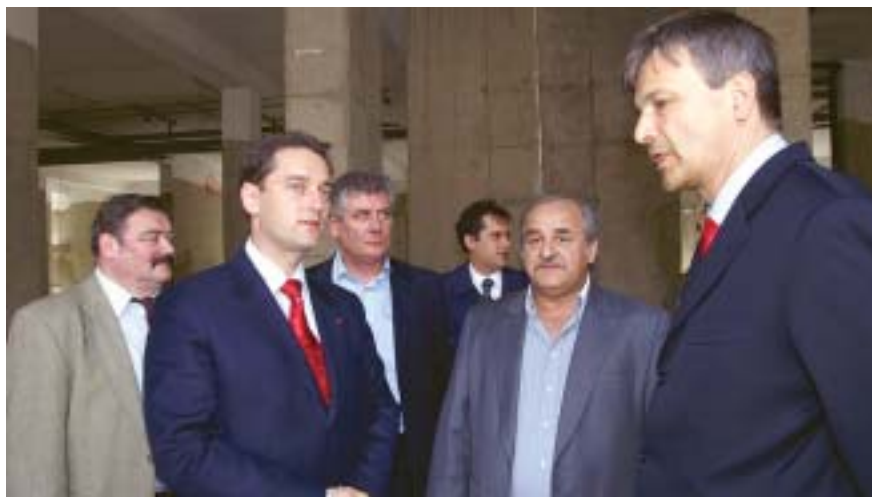
Előtérben Hunvald György polgármester, Zsuhár Árpád a Pendola Holding ügyvezető igazgatója, és Demszky Gábor főpolgármester. Mögöttük Adler György és Bán Imre a Garay téri választókerületek képviselői közöttük Gál György a gazdasági bizottság elnöke.

Az építőmesterek hagyományai szerint a bokrétaünnep a rossz szellemek elűzését, a jó szellem beköltözésének segítését szolgálja minden építkezésen, amikor az épület eléri a tervezett legmagasabb pontját.