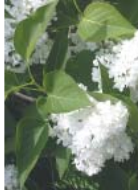
Május hónap azért is kedves nekünk, mert ez a

Mire ez a kis írás megjelenik, már május lesz, az a hónap, amelyről azt mondják, hogy az esztendő legszebb hava. Ez valóban így van. Május azt üzeni az embernek, hogy a tavasz legyőzte a telet, a világosság diadalmaskodott a sötétség fölött, a Húsvétban élhetünk, azaz Krisztus Urunk végleg legyőzte a bűnnek és a halálnak az uralmát. Igen, az élet győzött a halál fölött!