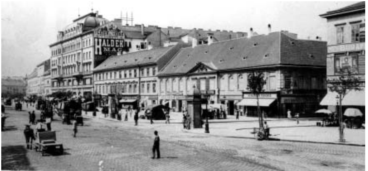
A Károly körút az 1800-as évek végén

Az Országutat 1875-ben szakaszolták, egyik részét a Nemzeti Múzeum épületéről Múzeum körútnak nevezték el, a másik részét pedig a Károly kaszárnyáról (mely jelenleg a Főpolgármesteri Hivatal) Károly körútnak hívták. Ez az épület eredetileg Invalidus-háznak épült. II. József (1780-1790) az invalidusokat, azaz a hadi rokkantakat átköltöztette Nagyszombatra, helyükre a 3. gránátos zászlóalj katonái kerültek. Az Invalidus-ház kisebb átalakítások után Károly kaszárnya lett, nevében alapítóját, III. Károly császárt és királyt (1711-1740) örökítve meg. Károly körút volt a neve az út kiszélesedésénél lévő Zsidó térnek is. A tér nevével a Király utca sarkán álló Orczy-házra, s annak bérlőire utalt. A Károly körút neve 1916-ban IV. Károly ki-