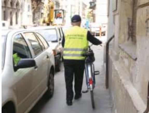
A lakosság nagy többsége szükségesnek véli a polgárőrség működését. Képiünk illusztráció

A kutatás közterület-felügyeletet érintő részének tanúsága szerint a budapestiek tízede a parkolóőröket is a közterület-felügyelők közé sorolja. A közterület-felügyelők feladatai között gyakran említették még a köztisztaság védelmét, az engedély nélküli utcai árusok valamint az engedély nélküli reklámeszközök használata elleni fellépést, és nem utolsósorban az utcák, terek, parkok állapotának védelmét.