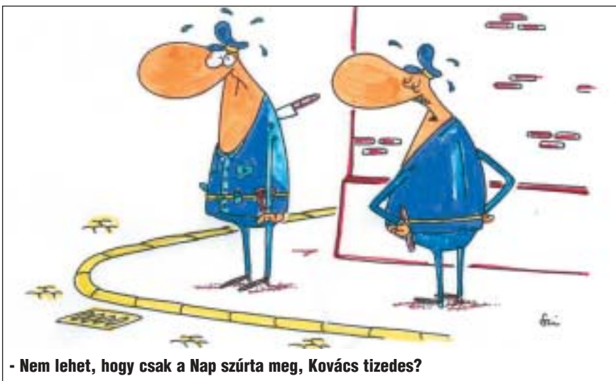
- Nem lehet, hogy csak a Nap szúrta meg, Kovács tizedes?

A Budapesti Rendőr-főkapitányság VII. Kerületi Rendőrkapitánysága kéri, aki a fenti grafikákon látható elkövetőket felismeri, jelenlegi tartózkodási helyükkel vagy a bűncselekményekkel kapcsolatban érdemleges információval rendelkezik, hívja a 461-8100 telefonszámot, illetve tegyen bejelentést az ingyenesen hívható 06-80-555-111 „Telefontanú” zöld számán, a 107 vagy a 112 központi segélyhívó telefonszámok valamelyikén.