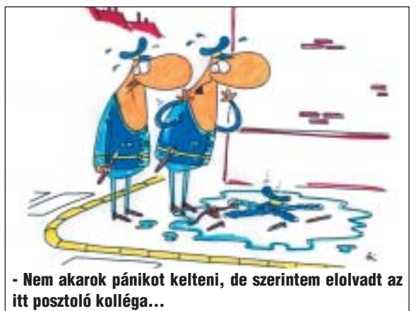
- Nem akarok pánikot kelteni, de szerintem elolvadt az itt posztoló kolléga...

35.000 állat- és növényfaj nemzetközi kereskedelmét. Hazánk a megállapodáshoz 1985-ben csatlakozott, a hazai végrehajtással kapcsolatos teendőket, azóta a környezetvédelmi tárca koordinálja.