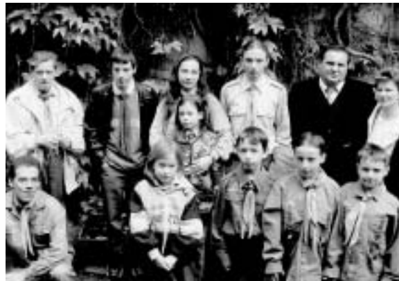
Avatás után. (A fekete-fehér fotót a cikk szerzője bocsátotta rendelkezésünkre)

Június 18-án zártuk a cserkészévet, azzal, hogy részt vettünk a 9 órai liturgián, majd hagyományainknak megfelelően, egy közeli cukrázdában közös fagyaltozást tartottunk. De ezzel még nem ért véget a nap, mert római katolikus testvéreink úrnapi körme-