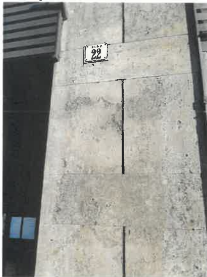
fényképek 2022. július