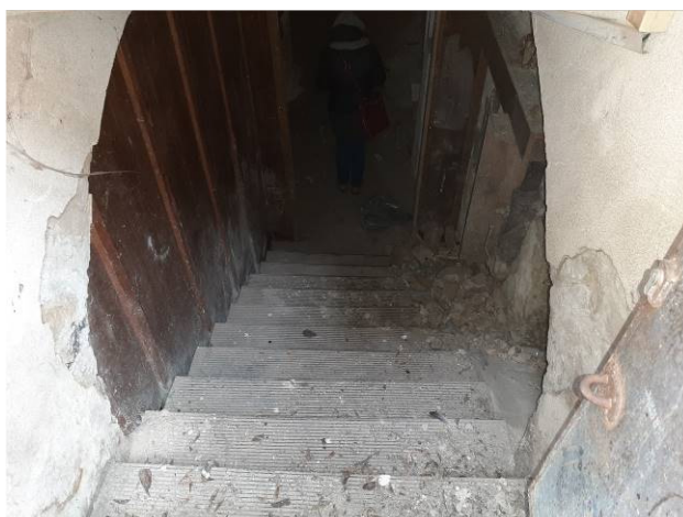
Utcai bejárat és bejáratú lépcső