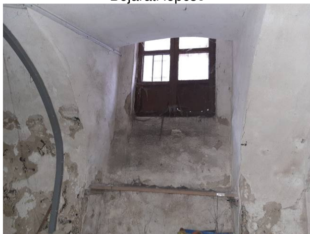
Utcára néző felülvilágító