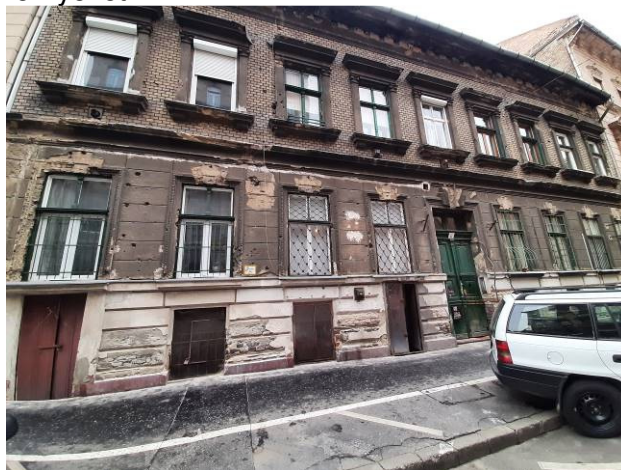
Jósika utcai homlokzat