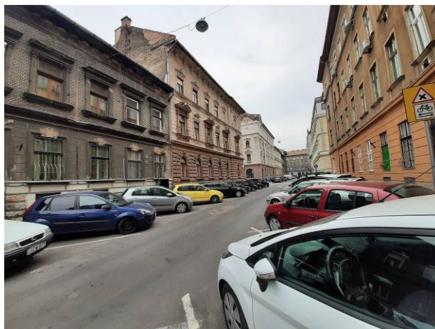
Utcakép - környezet