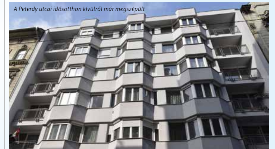
A Peterdy utcai idősothon kívülről már megszépült

A Peterdy utca intézményben két éve Európai Unió pályázat segítségével újultak meg a külső nyílászárók, és