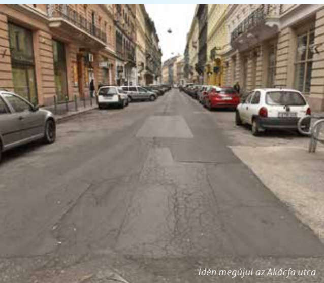
Idén megújul az Akácfa utca

Az önkormányzat az elmúlt évekhez hasonlóan ebben az évben is jelentős fejlesztéseket tervez Erzsébetvárosban, szem előtt tartva a kerületi lakosság igényeit. A nemrég elfogadott 2017-es költségvetésben ezért jelentős forrást csoportosított a képviselő-testület az Erzsébet Terv fejlesztési programra.