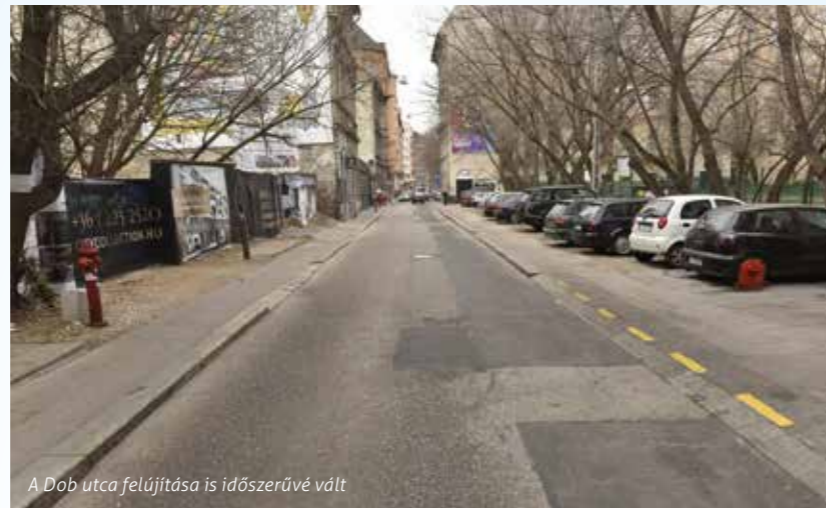
A Dob utca felújítása is időszerűvé vált

2017-ben jelentős közterület-fejlesztéseket tervez az önkormányzat, a közmuvelővel már meg is kezdődtek az egyeztetések, és több esetben a tervezés is folyamatban van. Az Akácfa utca és a Dob utca Kazinczy utca–Erzsébet körút közötti szakasza esetében a Fővárosi Vízművekkel közösen végzik majd a korszerűsítést. Az ivóvíz-hálózat rekonstrukcióját követően a teljes útburkolatot és a járdát is felújítják. Az utcák sűrű közműhálózata miatt sajnos szabad gyökérzetű fák ültetésére nincs lehetőség, azonban a korábbi gyakorlatnak megfelelően planténeres növényeket helyeznek majd ki.