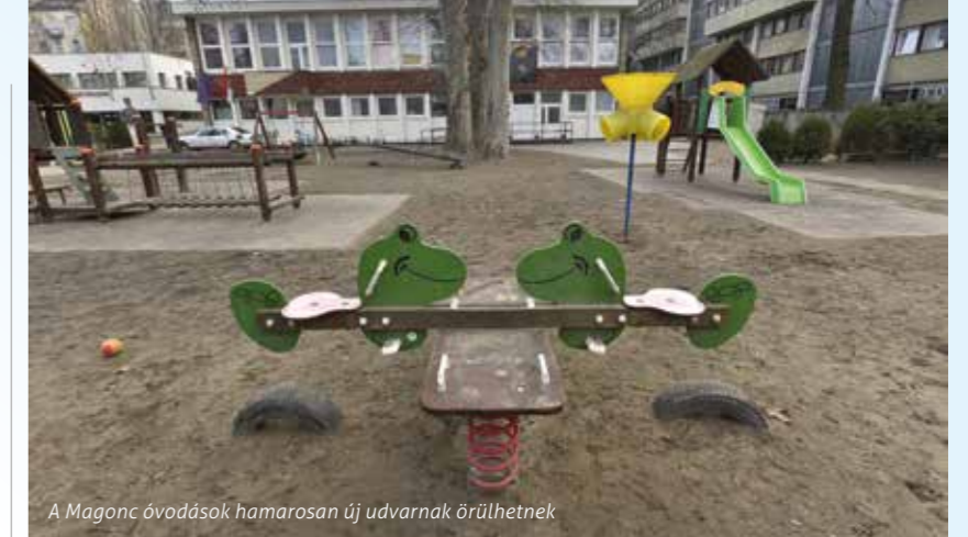
A Magonc óvodások hamarosan új udvarnak örülhetnek

Az elmúlt években a Magonc Óvoda épületének külső nyílászáróit, homlokzatát, tetőszigetelését és teljes fűtési hálózatát renoválták, a csoportszobákat felújították. Idén az udvart és a játszótérrel újítják majd meg: új játszótéri eszközöket telepítenek, és egy gyermek sportpályát is építenek. Meztlábás gyalogösvény, fára épített gyermekvár és más érdekes, kreatív játékok teszik majd játékosabbá, érdekesebbé a gyermekek mindennapjait. A felújítások során a Dob Óvoda a következő, ahol szintén az udvari játszótér modernizálják majd az óvoda adottságainak figyelembe vételével.