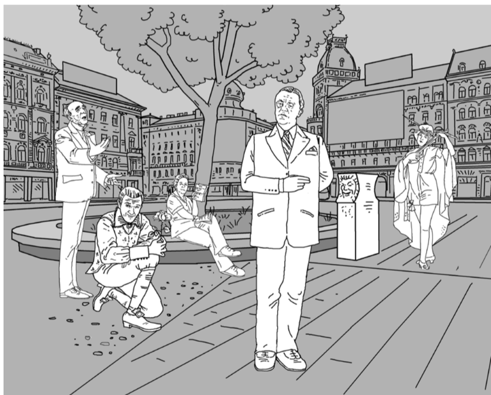
Szűcs Édua rajza