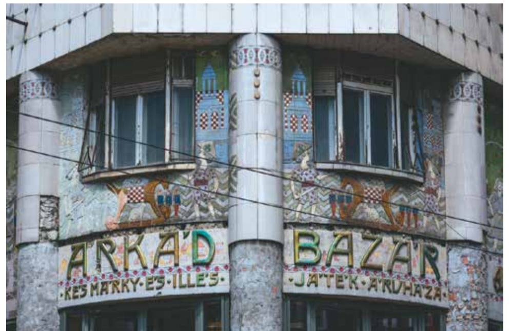
Az Árkád Bazár Zsolnaay-kerámiával díszített homlokzata