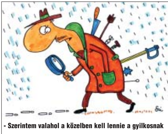
- Szerintem valahol a közelben kell lennie a gyilkosnak