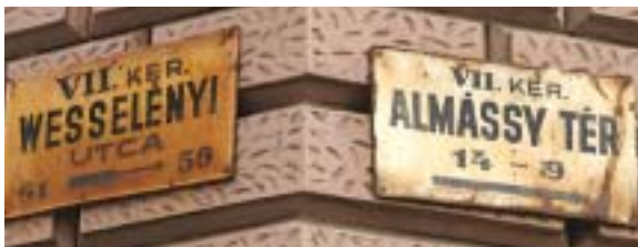
Néhány, szemmel láthatóan valóban cserére szoruló utcatábla a kerületben