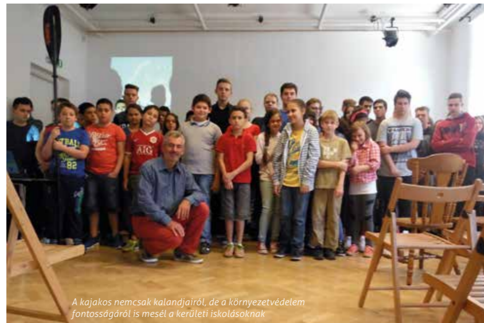
A kajakos nemcsak kalandjairól, de a környezetvédelem fontosságáról is mesél a kerületi iskolásoknak

a Budapeستől Athénig tartó szakasról, ami bemutatja egy hétköznapi ember nem hétköznapi utazásait.