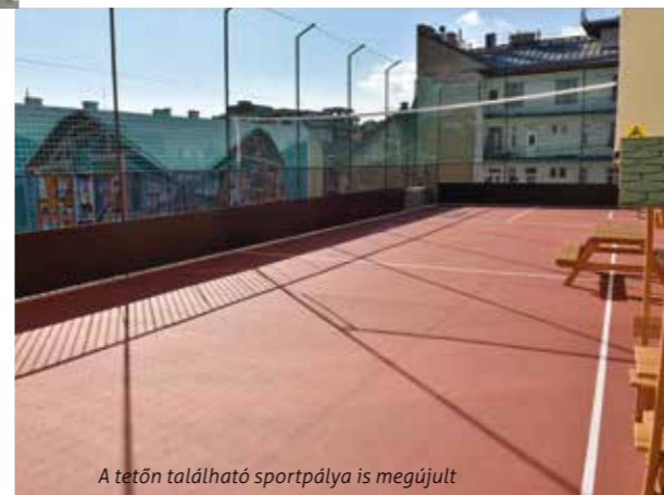
A tetőn található sportpálya is megújult