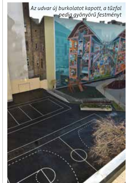
Az udvar új burkolatot kapott, a tűzfal pedig gyönyörű festményt

„A felújításoknak köszönhetően európai színvonalú iskolaudvar jött létre. Azt látom a szünetekben, hogy a diákok maximálisan kihasználják a lehetőségeket: fociznak, röplabdáznak, gondozzák a növényeket, a tűzfal pedig jó hangulatot teremt” – magyarázta lapunknak az ünnepség után Babó Dániel végzős diák, a diákönkormányzat elnöke.