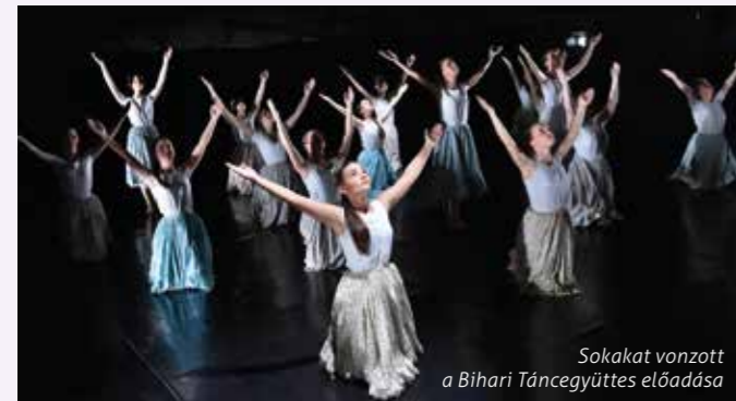
Sokakat vonzott a Bihari Táncgyűttes előadása

szeleme, otthont adó melege nemzedékeken át öröklődik. Együttesünk a kezdetektől a magyar néptáncok színvonalát megjelentetésének útjait keresi. A néphagyomány számunkra nem csupán történeti dokumentumgyűjtemény, archív anyag, hanem újabb és újabb néptáncalkotások forrása. A népművészet értékeinek végtelenül gazdag tárházából meríteni és a magyar nép-