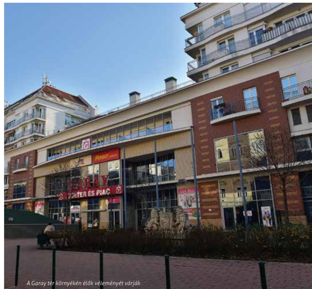
A Garay tér környékén élők véleményét várják

A Garay téri lakópark a VII. kerület legdrágább beruházásaként épült fel. Az eredetileg 2 milliárdosra tervezett komplexumot végül 10 milliárdból sikerült felhúzni. 2008. augusztus 14-én nyitotta meg kapuit. A szökőkút emlékezetünk szerint csak azon a napon üzemelt színes fényárban úszva. Mára már lefedve áll – emlékként –, mert hamar kiderült, hogy üzemeltetése tetemesen megnöveli a társasház üzemeltetési költségeit.