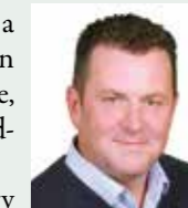
Devosa Gábor frakcióvezető MSZP

Azon dolgozunk, hogy lehetőséget kapjanak a fejlesztésekre a lakóközösségek, esélyt a jobb jövőre a gyerekek, hogy egy nyugdíjasnak se kelljen döntenie abban, hogy fűt télen vagy eszik. Ezért már az idei költségvetésben is majd 100 millió forintnyi plusz támogatásra tettünk javaslatot, többek között a társasház-felújítás pályázat, a gyógyszer-támogatás, az iskolások kultúr-és sport programjai, a roma kisebbségi önkormányzat tételsorainak bővítésére, és a szociális rendelet több pontjának módosítására. A 2016-os költségvetés összeállításakor is ilyen szempontok alapján fogjuk módosító javaslatainkat benyújtani.