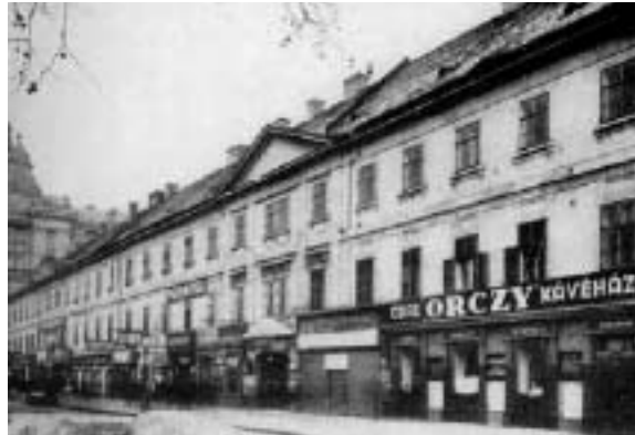
Korabeli fotó az Orczy-házzal