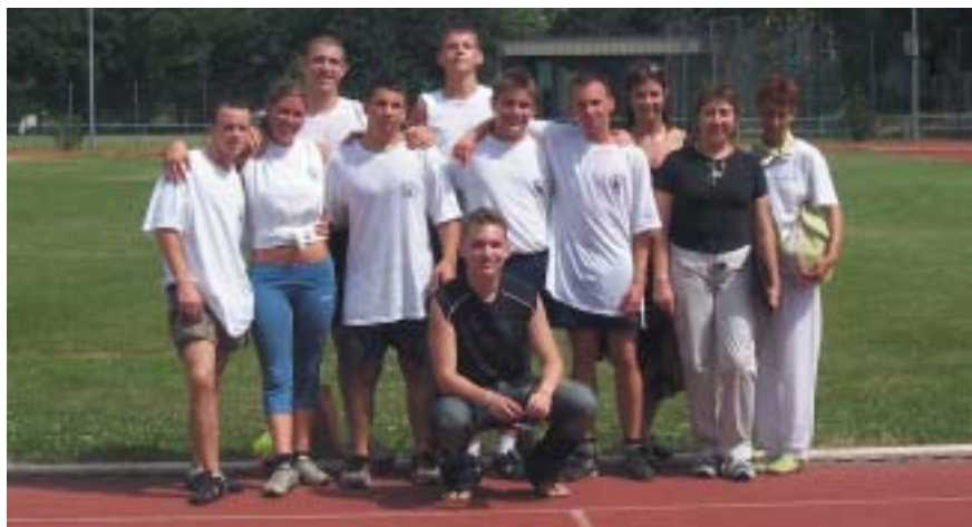
Az eredményes testnevelési érettségi vizsgát tett diákok és felkészítő tanáruk