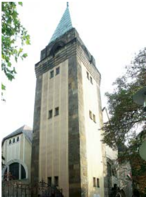
A református templom a Városligeti fasorban

Minden érdeklődő jelentkezését várjuk személyesen, vagy telefonon, akkor is, ha az időpont nem megfelelő. Időpont változtatás lehetséges, szeretnénk, ha senki nem maradna ki a hitoktatásból. A hittanórákat a gyülekezeti teremben tartjuk (VII. Damjanich u. 28/b.).