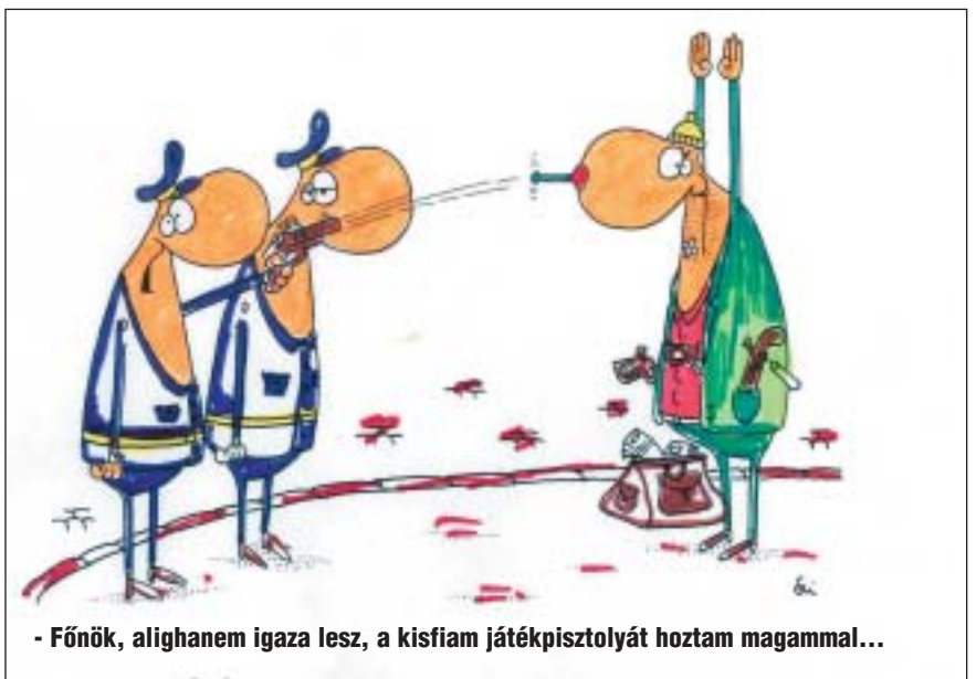
- Főnök, alighanem igazam lesz, a kisfiam játékpisztolyát hoztam magammal...

Az eddigi tapasztalatok - elsősorban a VII. kerületi Rendőrkapitányság beszámolója, a civil szervezetek és a lakosság visszajelzése - alapján a térfigyelő rendszer működése nagymértékben elősegíti a közbiztonság minden területének pozitív elmozdulását. (Folytatjuk)