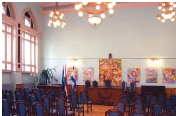
A közösségi ház díszterme

felkeltsük az érdeklődésüket és alakítsuk az ízlésüket is. Ehhez a legnagyobb segítséget a civil szervezetek adják, akik közül néhányan itt az épületben tevékenykednek. A különböző programokra elhozzák az ismer-