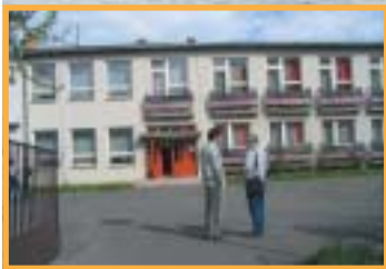
A ruzsinai vízparti gyermektábor