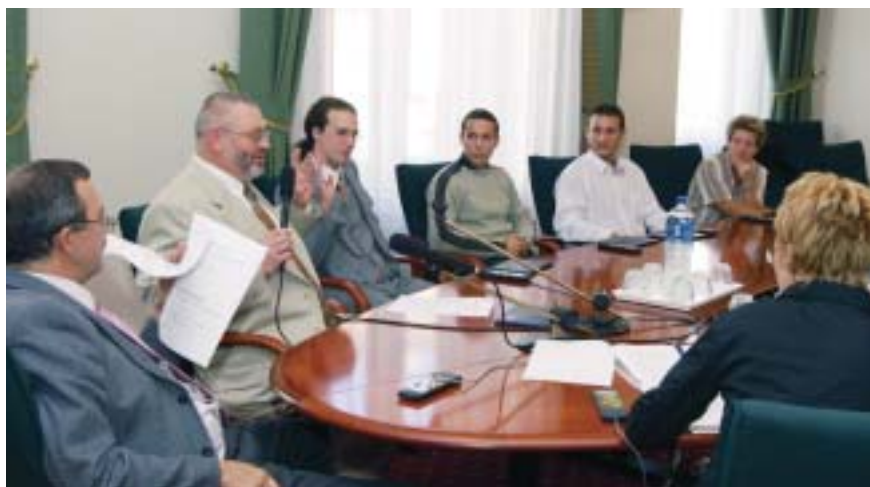
Október 9-én és 10-én mind a 10 kisebbségi önkormányzat megtartotta alakuló ülését. Képpünkön a német képviselők.