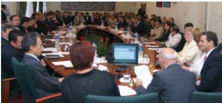
Alakuló testületi ülés, október 14-én, a Polgármesteri Hivatal dísztermében

A 2006. évi önkormányzati választásról készített összefoglalónkat, a Helyi Választási Bizottság tájékoztatóját, a pártok vezetőinek összegzését és az alakuló ülésről szóló beszámolót a 2-től 7. oldalig találják olvasóink.