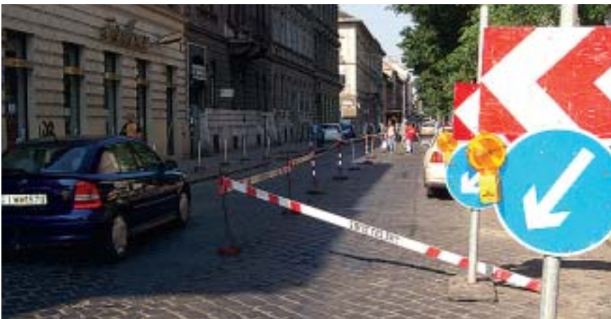
A közművek cseréje már korábban megtörtént. Fotónk a Nefelejcs utcában készült.

Erzsébetvárosban még az ősszel megújul az Izabella utca is a Rózsák tere és a Király utca között.