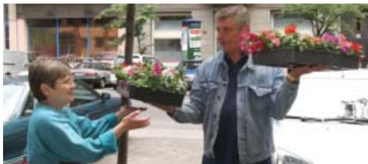
Képünk illusztráció, mely az egyik korábbi virágosítási akción készült

Az idei virágosítási akció május 19-én lesz, ekkor 11750 tő egyházi virágot szállítanak ki a választókerületben lévő társasházakhoz. A virágok idén földlabdában érkeznek, hiszen a korábbi években kiadott virágládák még bizonyára megvannak a lakóknál. Bővebb információ a 322-98-15-ös telefonszámon kérhető.