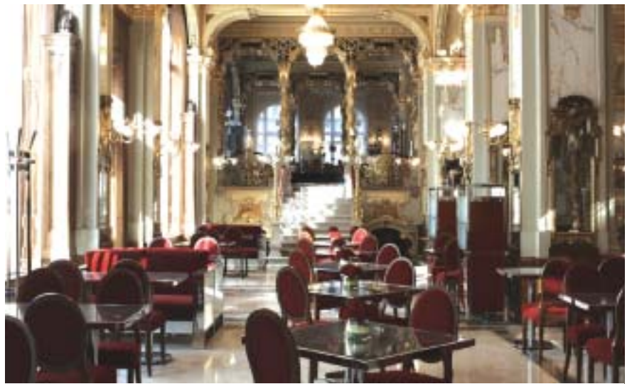
Újra régi pompájában a világhírű palota és kávéház