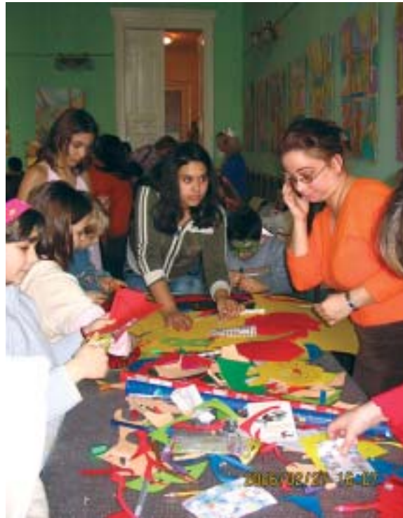
Képiünk illusztráció, egy korábbi rendezvényről.

Különböző rendezvényeikhez ök kedvezményes áron bérelhetnek helyet, igénybe vehetik a klubhelyiséget, a dísztermet és a tárgyalót,